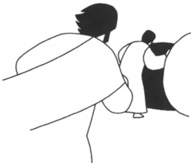
La tomba era vuota

Per rispondere occorre mettersi al posto di chi ha incontrato Gesù e l’ha ascoltato: gli apostoli vedevano il Lui quello che non avevano trovato in altri, anzitutto la coerenza, dimostrata nell’accettazione della condanna e della morte in croce. Tutti coloro che hanno riposto fiducia in lui, quando è morto, si sono sentiti disorientati: gli apostoli hanno perso il loro maestro e hanno provato lo stesso smarrimento che ciascuno di noi prova quando si fa un cammino con qualcuno, che poi viene a mancare. I sentimenti che si provano sono, appunto, di disorientamento, amarezza e grande dolore. Il bisogno di mantenere vivi gli affetti più cari è esperienza umana che tutti noi possiamo capire.