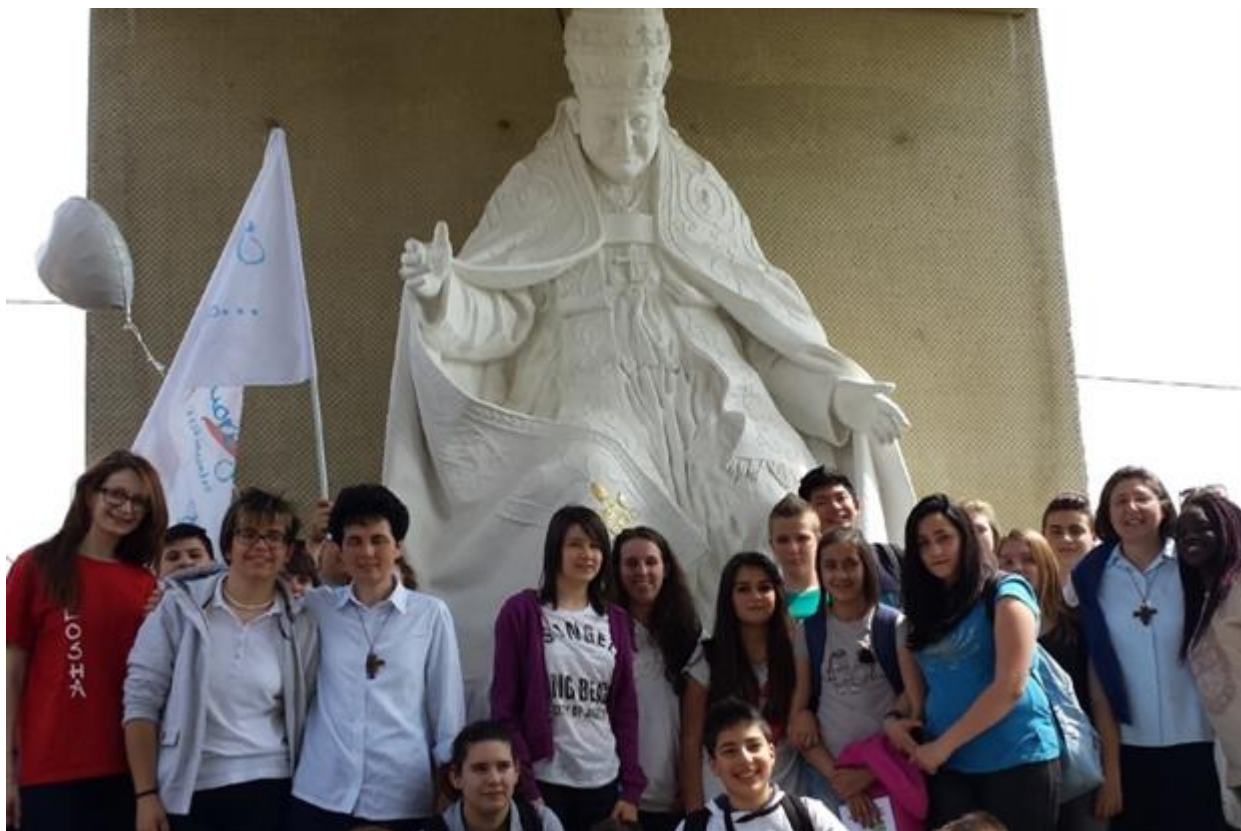
Giovani pellegrini sotto la statua che rappresenta Giovanni XXIII a Sotto il Monte

Per tutto il tempo dell'esposizione dell'urna con il corpo di san Giovanni XXIII sarà possibile prenotare la propria visita. L'invito che la curia di Bergamo rivolge ai pellegrini è di prenotarsi online presso l'indirizzo www.santuariosangiornixxiii.it dove si potranno vedere le fasce orarie libere per accedere alla venerazione delle reliquie.